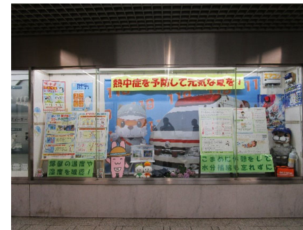
広報コーナー展示