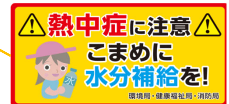
マグネットポスター